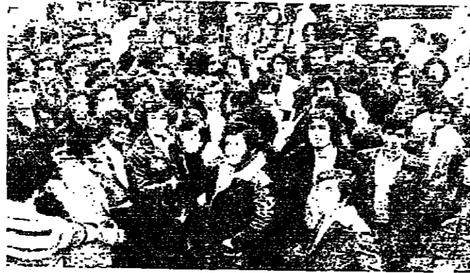
الطلاب المهينون عند تظاهرتهم امام وزارة التربية امس

وقد جاء اضراب طلاب المدرسة المهنية بعد سلسلة جماعات موجهة تقديراً لانتهاج السلطات الخساسة... اعلان امس ، طلاب المدرسة المهنية بالدكوادة الاضراب العام ، احتجاجاً على قانون الزوابط المهنية الجديد ، وتوجهوا الى وزارة التربية حيث تصفوا في باحتها بشكل تظاهري ، والتفوا بوزير التربية السيد ماجد صباه الذي وعد بتعديل قانون الزوابط المهنية .